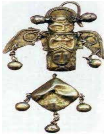
Fotoğraf 13. Tanrıça Umay'ın resminin yer aldığı kolye. Köybalı köyü. Hakasya (VI-XII yüzyıllar). 13

Sanatsal açıdan, Koybalı köyünden çıkarılan altın kolyeler, Tanrıça Umay'ın kuş kadın formunda betimlenmesine olanak tanımıştır. Umay-kuş, kadın başı ve kuğu kanatlarına sahip efsanevi bir varlıktır. Yüzündeki sert ifade, dünyevi ayartmalara karşı dayanıklı olmadığını ima eder gibi görünmekte ve bu da imajını daha da gizemli hale getirmektedir.