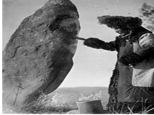
Fotoğraf 9. Hakasyalı kadın, kaya üzerine çizilmiş Umay tasvirine ritüel yemek sunarken.

ikonografisinin oluşumunda, göksel metreslerin (anne ve kız) arkaik Sibiryâ kültürüne olan etkisi modern döneme kadar taşınmıştır. Altaylı kadınlar, kaya üzerine oyulmuş Umay tasvirini yad etmek ve önlerine yiyecek koymak suretiyle ondan bolluk, bereket ve çocuklarını koruması temennisinde bulunurlar.