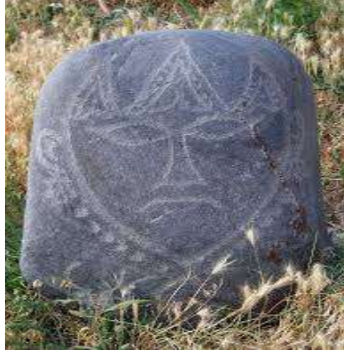
Fotoğraf 3. Kırgızistan'ın Issık-Kul havzasından, üç boynuzlu başlık takmış bir kadın yüzünün görüntüsü ve boncuk şeklinde boyun süslemeli bir kaya 6

durumlarda bile üç boynuzlu başlık kullanılmamıştır (Kızlasov, 1949, s.50).