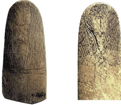
Fotoğraf 7. Kemik plastinkalar. Okunevskaya kültürü (M.Ö. III binin sonu-II başı). Hakas Ulusal Bölgesel Müzesi. 9

Ancak genel olarak eski Türklerin Umay'ı nasıl tasvir ettiği konusunda hala ortak bir görüş bulunmamaktadır. Bununla birlikte, evrensel Mitolojik Ana (veya Büyük Ana Tanrıça) kavramı çerçevesinde Umay kültü, Altay'da farklı tarihsel dönemlere ait bir dizi ikonografik kanonu içermektedir (Jernosenko, 2019, s.312). Ayrıca, taşa çizilmiş kadın ya da kız figürleri de Umay ile ilişkilendirilir. Bu tür tasvirler örnek olarak, M.Ö. tarihine ait “Kız tas” kaya tasvirini gösterebiliriz.