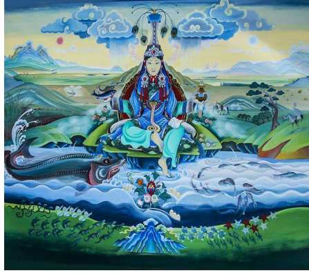
Fotoğraf 18. Doğayla harmonik ilişki içerisinde tasvir edilen Umay ikonografisi. 18

Bazı modern tasvirlerde, Umay'ın iri göğüsleri, geniş kalçaları ve elinde tuttuğu süt kasesi, onun mitolojik doğurganlık arketipine ve çocuksuz ailelere Süt Ak Göl'den bebek ruhu getirdiğine yapılan bir göndermedir. Kasedeki sütün, doğacak olan canlıların embriyolarını içerdiği varsayılır.