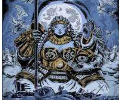
Fotoğraf 15. Uzun örülü saçları olan ve bardaş kurarak oturmuş Umay tasviri. 15

Ancak başlangıçtan bugüne kadar, koruyucu bir iye olarak Umay imgesi, Sibiry ve Orta Asya'nın Türkçe konuşan halklarının günlük yaşamında, dini bilincinde, mitolojisinde ve güzel sanatlarında önemli bir yer edinmiştir. Buna rağmen, Umay'ın ikonografik tasviri konusunda hâlâ bir fikir birliği bulunmamaktadır.