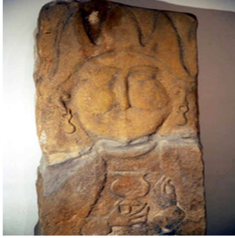
Fotoğraf 2. 10-11. yüzyıllara ait Umay Ana heykeli. Kulaklarındaki takısı, başındaki üç boynuzu ve elindeki kadehi ile. 5

Güney Kazakistan'da bulunan bazı tasvirlerin Umay Ana'yı canlandırdığı iddiası tartışmalıdır. Bunun temel sebeplerinden biri, tek küpe takma geleneğinin daha çok erkeklere özgü bir özellik olarak bilinmesidir. Bu nedenle, bu tasvirlerin rahip figürlerine ait olabileceği öne sürülmektedir. Türk halklarının temel süs motifleri olan "koşkar muiz" (koç boynuzu), "tuye taban" (deve ayak izi) ve "smar muiz" (tek boynuz), doğurganlıkla ilişkilendirilmekte ve Mitolojik Ana'yı ya da somut bir varlığa dönüşen Umay'ı simgelemektedir. Özellikle Ana Tanrıça'nın maraluka (boynuzlu geyik) biçimindeki tasvirleri, Altay bölgesinin neredeyse her yerinde görülmektedir. Bu kapsamda, Kuilyu Mağarası, Kuyus, Biçiktu-Boom, Kalbak-Taş, Elangaş, İrbis-Tuu gibi yerlerde bulunan ünlü petroglif anıtları örnek gösterilebilir.