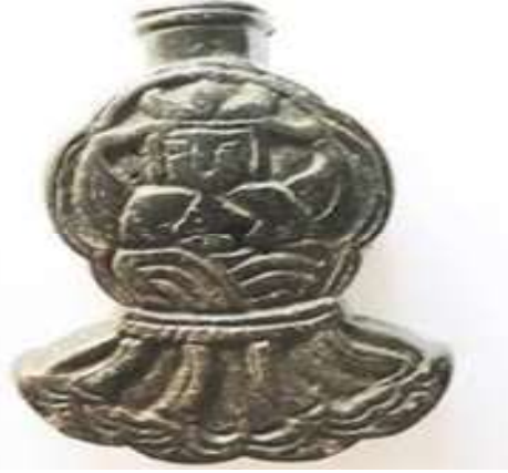
Fotoğraf 11. Üç boynuzlu Umay'ın kabarmasını içeren ortaçağ bronz iğne kutusunun yarısı (N. M. Martıanov'un adını taşıyan Minusinsk Bölge Yerel Kültür Müzesi, https://vk.com/martyanov.museum )

SSCB Bilimler Akademisi Antropoloji ve Etnografya Müzesi koleksiyonlarında, Umay'ın sembolik bir tasviri, oklu küçük bir yay ve üzerine deniz kabukları dikilmiş kırmızı bir kumaş şeridi şeklinde bulunur. Bu tasvir, Şorlar, Sagaylar ve Beltirlerin karışık yaşadığı Djilani ulusundan (Taştıp Nehri vadisi) elde edilmiştir (Potapov, 1973, dipnot 28). Çocukları koruyan kadın ruhunun Umay'a ait olduğu düşünülen bu görüntüde, sanki uçmaya hazır bir şekilde bir ok taşıyan figür, çocuğa benzeyen kötü bir ruha ok atmaktadır. Altaylılar, beşiklere demir kırımler asarak, kötü ruhların çocuğa yaklaşmasını engellemeye çalışırlardı.