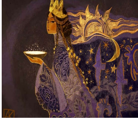
Fotoğraf 19. Elinde Süt Ak Göl'den aldığı çocuk embriyonları ile dolu kase tutmuş Umay tasviri. 19

Umay'ın yüz güzelliği ve doğaya, doğadaki varlıklara hâkimiyeti, onun kadın başlangıcı ile eş anlamlı bir figür olduğunu vurgular. Bu tür tasvirler, Umay'ın hem doğurganlık hem de yaratıcı gücünü öne çıkaran güçlü bir ikonografik anlam taşır.