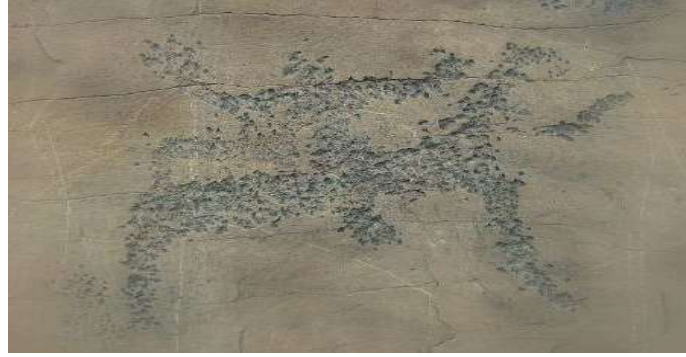
Fotoğraf 6. Sulek kaya çizimi üç boynuzlu savaşçı veya Tanrı tasviri 8

Şamanlara göre Ana Tanrıça Umay, genellikle kalın altın sarısı saçlı ve tarak benzeri bir saç modeliyle betimlenmiştir. Umay kültü, yalnızca Altaylılar arasında değil, Hakaslar, Tuvalar, Kırgızlar ve Özbekler gibi Orta Asya ve Güney Sibirya'nın Türkçe konuşan diğer halkları arasında da geniş bir yayılım göstermiştir. Teleütler, Umay'ı "tarak benzeri saçlarla", Şorlar ise "ipek giysiler içinde açık tenli bir kadın" olarak tanımlamaktadır.