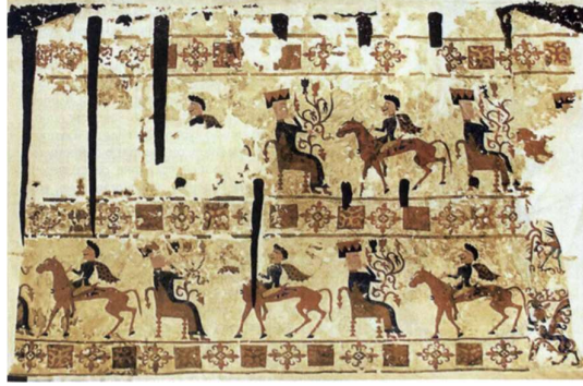
Fotoğraf 10. Tanrıça Umay'ın tasvir edildiği büyük keçe halı. Altay Dağı. M.Ö. 5-3 yüzyıllar. 11

Umay'ın ikonografik tasvirlerine sadece kaya üzerindeki çizimlerde, metal levhalarda ve ahşap üzerindeki tasvirlerde rastlanmaz; aynı zamanda halılarda da görülür. Altay'da bulunan ve M.Ö. 5-3. yüzyıllara ait keçe halılarda, elinde dünya ağacını simgeleyen şamdan veya metal levha tutmuş, oturmuş halde tasvir edilen Umay, ath savaşçıları karşılamaktadır.