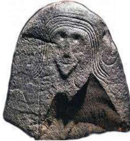
Fotoğraf 8. Stel “Kız tas” (Kız-Taş). Okunevskaya kültürü (M.Ö. 3. binyılın sonu - 2. binyılın başı). Minusinsk Yerel Kültür Müzesi. 10

Ancak genel olarak eski Türklerin Umay'ı nasıl tasvir ettiği konusunda hala ortak bir görüş bulunmamaktadır. Bununla birlikte, evrensel Mitolojik Ana (veya Büyük Ana Tanrıça) kavramı çerçevesinde Umay kültü, Altay'da farklı tarihsel dönemlere ait bir dizi ikonografik kanonu içermektedir (Jernosenko, 2019, s.312). Ayrıca, taşa çizilmiş kadın ya da kız figürleri de Umay ile ilişkilendirilir. Bu tür tasvirler örnek olarak, M.Ö. tarihine ait “Kız tas” kaya tasvirini gösterebiliriz.