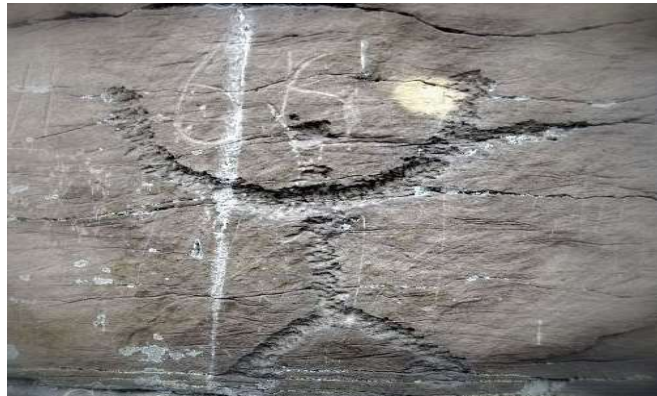
Fotoğraf 5. Sulek'te kaya üzerine oyulmuş üç boynuzlu Umay'ın tasviri 7

Hakasya'da bulunan Sulek yazıtlarındaki iki önemli figür de bu bağlamda dikkat çekmektedir. Araştırmacılar, bu figürlerden birinin Umay'ı, diğersinin ise Tengri'yi temsil edebileceği görüşündedir (Kızlasov, 1998: 39-53; Surazakov, 1994: 45-55). Bu tasvirlerde, Umay'ın geleneksel tanımıyla uyumlu, üç boynuzlu başlıklarla ilişkilendirilen benzersiz detaylar yer almaktadır. Oyulmuş çizgiler ve figürlerin kompozisyonu, iye Umay'ın ikonografik anlatısına dair güçlü ipuçları sunmaktadır.