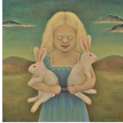
Görsel 5. Antoinette Kelly, Albinolar, yağlıboya, 2017, (Mackowiak, 2019, s. 189)