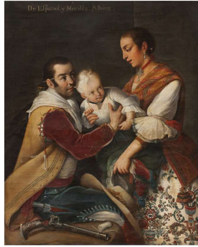
Görsel 4. Miguel Cabrera, 6. İspanyol ve Morisca'dan Albino Kız, 1763, yağlıboya, (Katzew, 2016, s. 153)