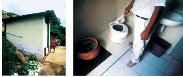
Görsel 6. Marjetica Potrč, “Dry Toilet”, 2003- halen devam ediyor, Venezuela

da katılımcı süreçler (örneğin birlikte bahçe kurma, tohum paylaşımı) üzerinden çalışır. Tohum ve bellek üzerinden üretilmiş bir kavramsal temelde tohumlar sadece biyolojik değil, kültürel hafızayı da taşır. Ya da bahçeyi yalnızca estetik bir alan değil, bir direniş alanı olarak gören yaklaşımlar (örneğin permakültür bahçeleriyle sanatsal enstalasyonların üretilmesi) yaygındır. Sanatta tohumların ve bahçelerin estetik ve politik temsili önemlidir. Bu tür projeler “süreç temelli sanat”, “ekososyal pratikler” ya da “topluluk sanatı” başlıkları altında değerlendirilir. Slovak sanatçı Marjetica Potrč katılımcı ekolojik projelerle tanınır. Latin Amerika’da topluluk temelli su yönetimi, gıda egemenliđi gibi agroekolojik konuları mimari ve sanatla işler. Örneđin Potrč ‘un Caracas Vaka Projesi, Almanya Federal Kültür Vakfı ve Venezuela Çevre Bakanlıđının katkılarıyla tasarladığı “Dry Toilet” (2003 – halen devam ediyor) adlı çalışması bu projelere örnek verilebilir. Caracas’ta haftada en fazla iki gün belediyeden su alabilen vatandaşlara ‘gayri resmi’ bir altyapı sağlayan proje, akan suyu olmayan La Vega mahallesi için atıkları toplayıp gübreye dönüştüren, susuz ve ekolojik olarak güvenli bir tuvaletten oluşmaktadır. Tuvalet, bölge sakinleri, mahalle derneđi ve mimar Liyat Esakov ile birlikte inşa edilmiştir (Arte-util, 2025)