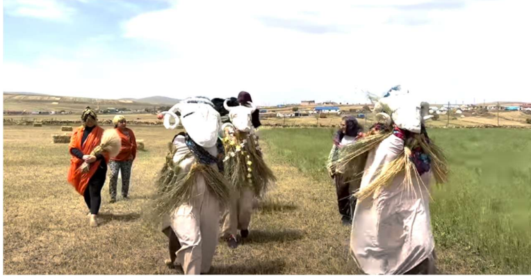
Görsel 7. Fernando García-Dory, “Boğatepe Gelecek Sözleşmesi” Performans, 2022, Boğatepe Katılımcılar: Boğatepe köyü halkı, Kars ve Ağrı Dağı civarından çobanlar, sığırtmaçlar, yerel peynir üreticileri ve Yerküre Kooperatifi

Günümüz sanatında sanatçı, toplumsal ilişkiler üreten ve bu ilişkiler üzerinden anlam inşa eden bir özne olarak, multidisipliner ya da disiplinlerarası bir çalışma alanı içinde konumlanmaktadır. Bu çerçevede Slow food hareketi ile ekolojik, agroekolojik ve katılımcı yaklaşımlar, yalnızca ekonomi, işletme, kooperatifçilik ya da sosyoloji gibi alanların konusu olmaktan çıkarılarak, sanatçının kurduğu ilişkiyel evren içinde sanatsal üretimin yapısal bir bileşeni hâline gelmektedir. Örneğin; agroekoloji ve çoban kültürü üzerine çalışan sanatçı Fernando García-Dory, Avrupa’da “Pastoral Okul” gibi projelerle hem eğitim hem üretim alanlarını sanatla birleştirir. Kırsal yaşamı sanatsal pratiğe dahil eder. 2022 yılında 17. İstanbul Bienali’ne katılan Güzel Sanatlar, Kırsal Sosyoloji ve Agroekoloji üzerine eğitim almış olan İspanyol sanatçı Fernando García-Dory’nin “Kars Boğatepe Gelecek Sözleşmesi” adlı projesi, 2009’da başlattığı sanat, tarım ve kırsal alanı kapsayan, günümüzde şehir ve kırsal alan arasındaki ilişkide bölgelerin, jeopolitiğin, kültürün ve kimliğin rolünü inceleyen INLAND (kırsal / iç kesim) projesinin bir ayağıdır. Bu projesinde Kars ve Ağrı Dağı civarından çobanlar, sığırtmaçlar, yerel peynir üreticileri, Boğatepe Çevre ve Yaşam Derneği (Çev-Der) ve Yerküre Kooperatifi de dahil olmuştur.