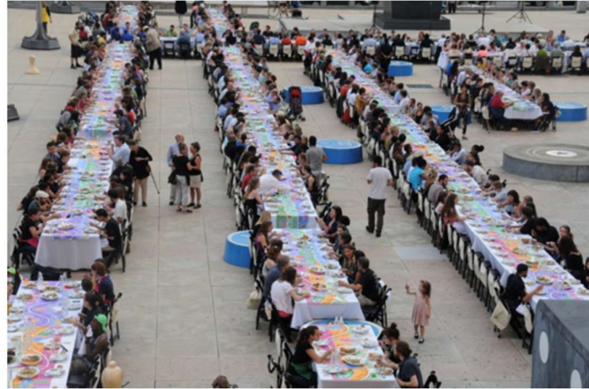
Görsel 4. Rirkrit Tiravanija, “Untitled, (Free)”1990. Görsel 5. Lucy & Jorge Orta, “The Meal”2013