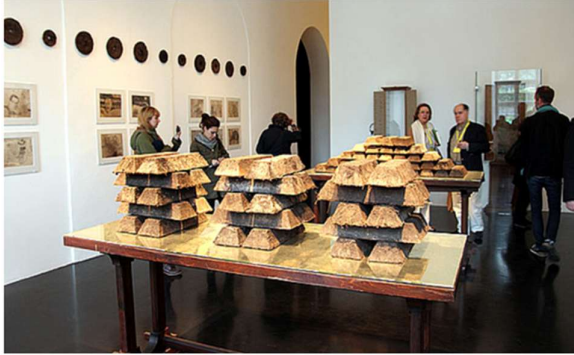
Görsel 1. Claire Pentecost, “Toprak Şekli”, Documenta 13 Kassel, 2012.