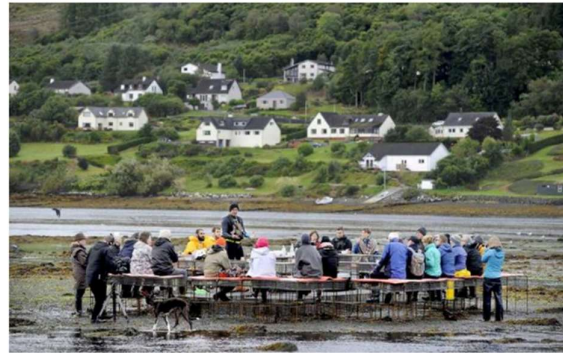
Görsel 3. CLIMAVORE–Cooking Sections, Gelgit Bölgeleri üzerine halka açık atölye, performans 2017, Skye Adası